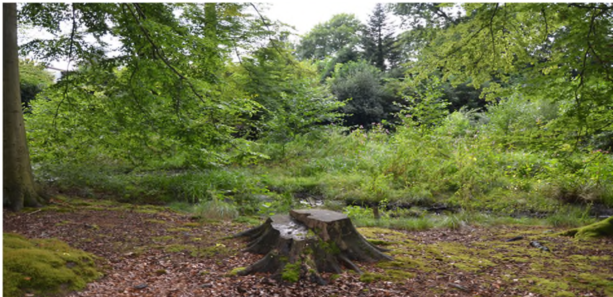
Abbildung 4 Einblick in das Naturschutzgebiet