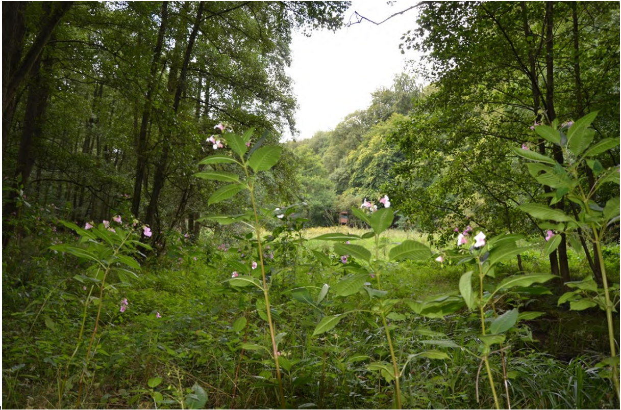
Abbildung 5 Einblick in das Naturschutzgebiet