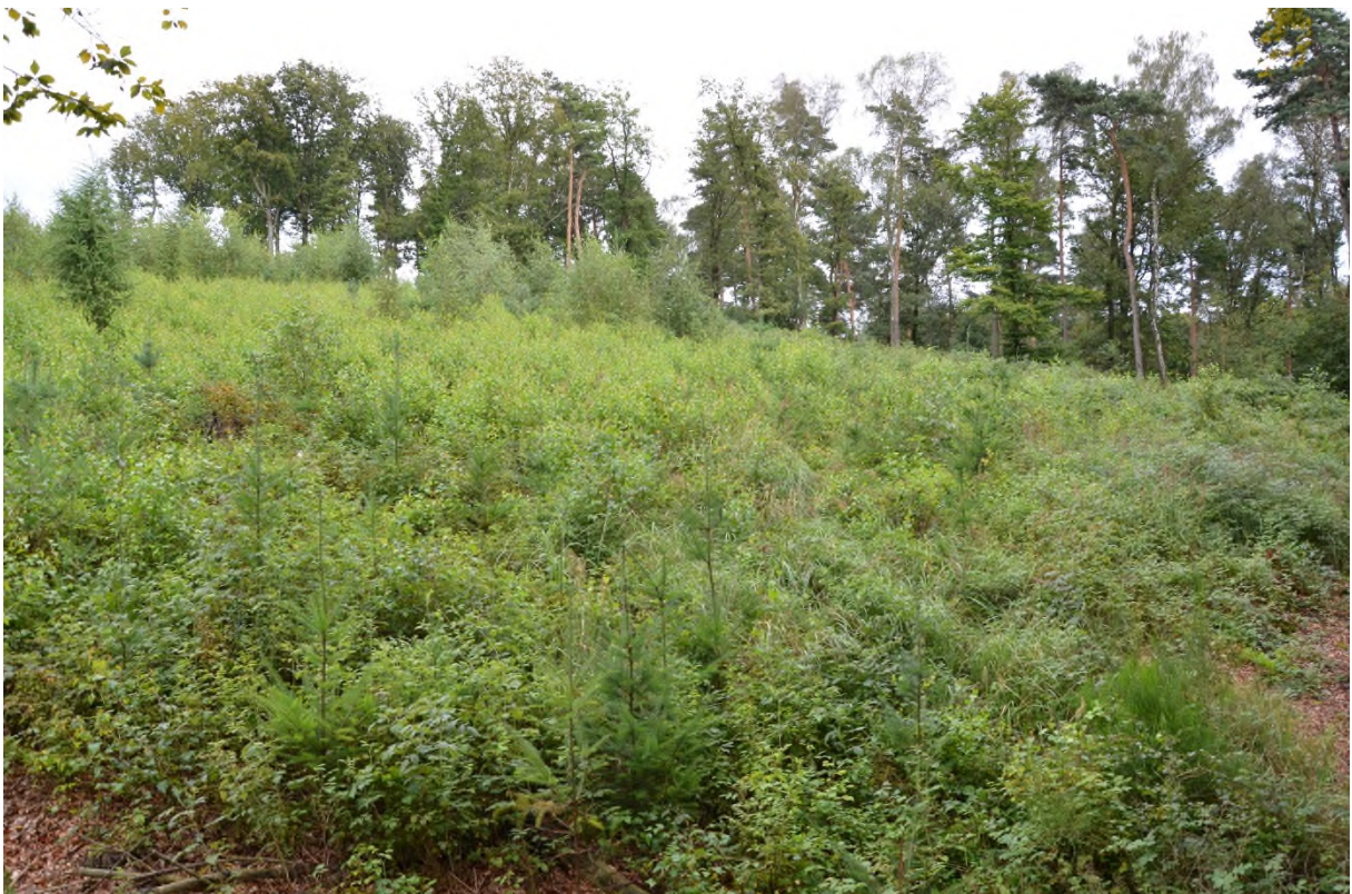
Abbildung 14 Aufforstung der Kyrill-Fläche