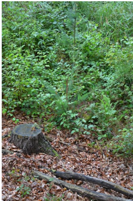
Abbildung 16 Aufforstung der Kyrill-Fläche, Fegestelle