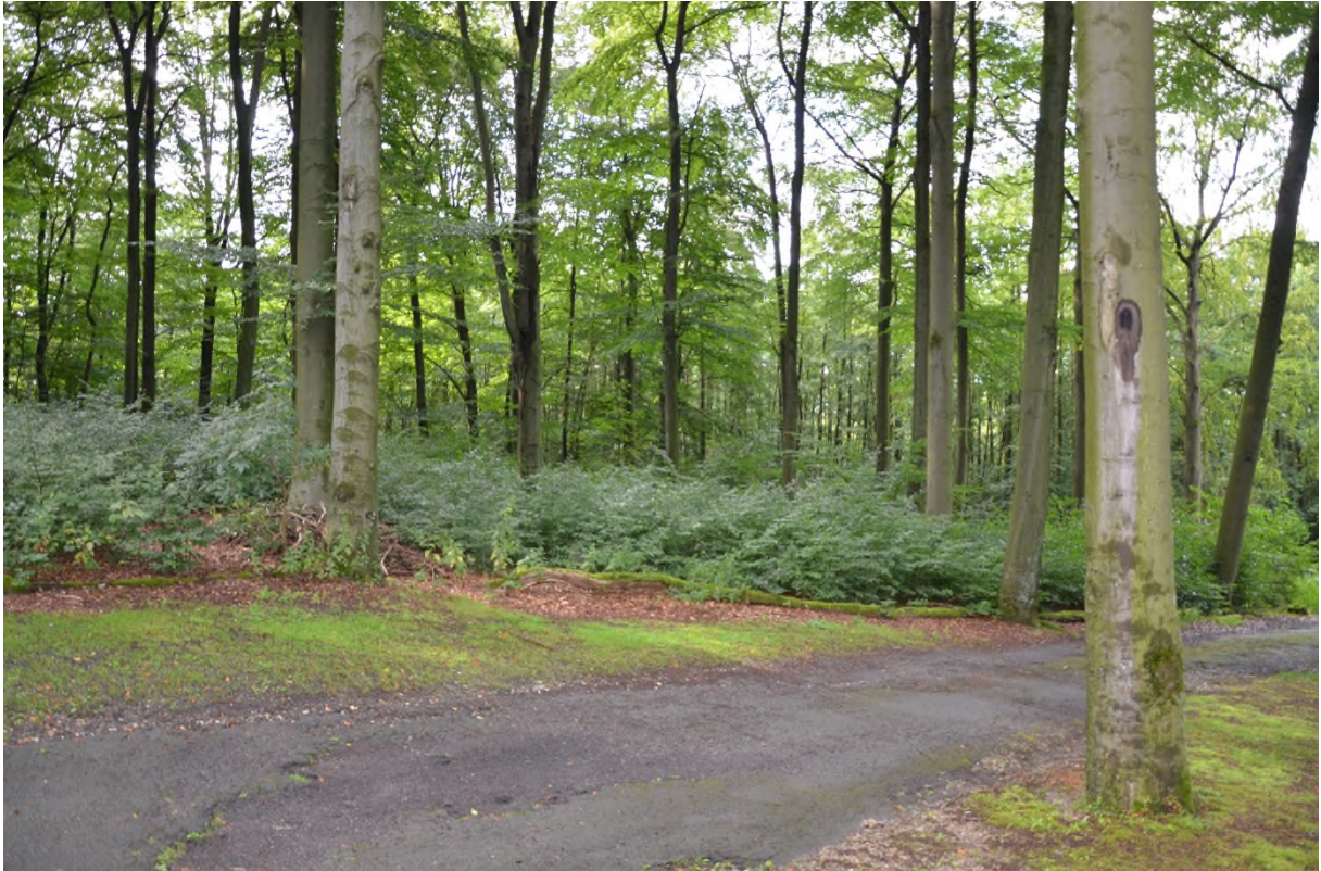
Abbildung 9 Naturverjüngungsfläche