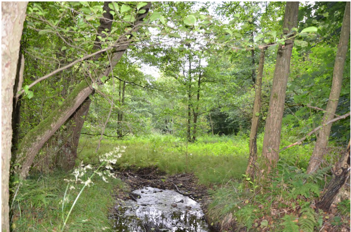
Abbildung 6 Einblick in das Naturschutzgebiet