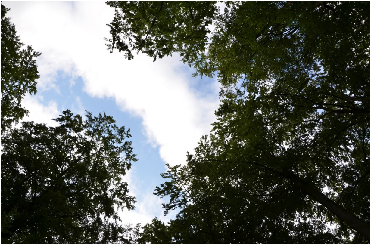
Abbildung 11 Auslichtung der Kronen