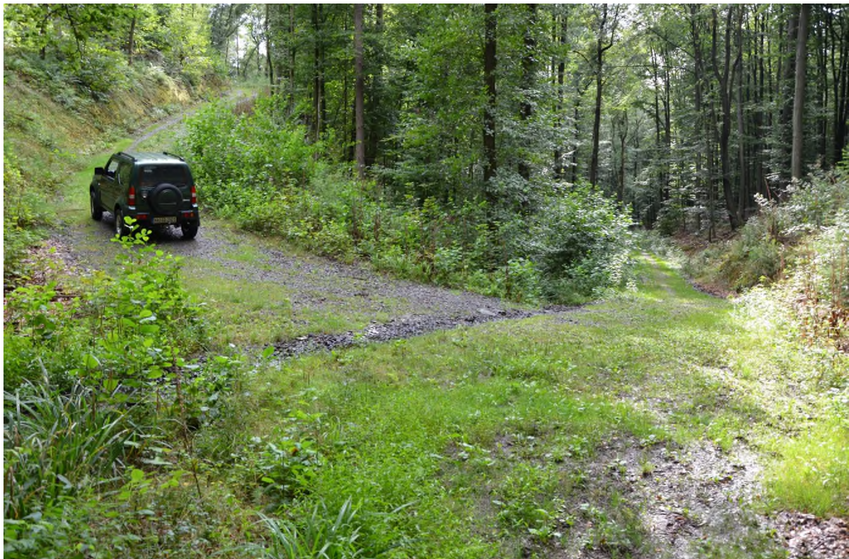
Abbildung 3 Weg mit Bachlauf