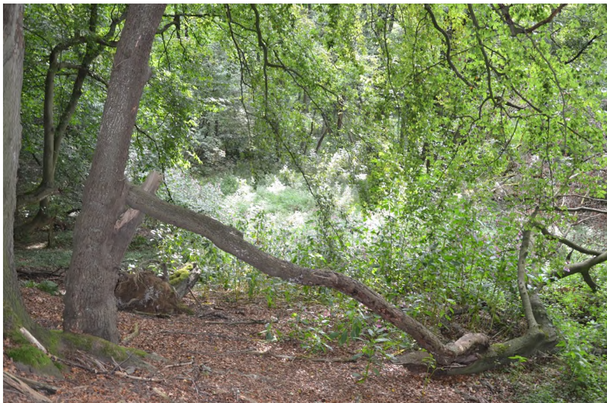
Abbildung 7 Einblick in das Naturschutzgebiet