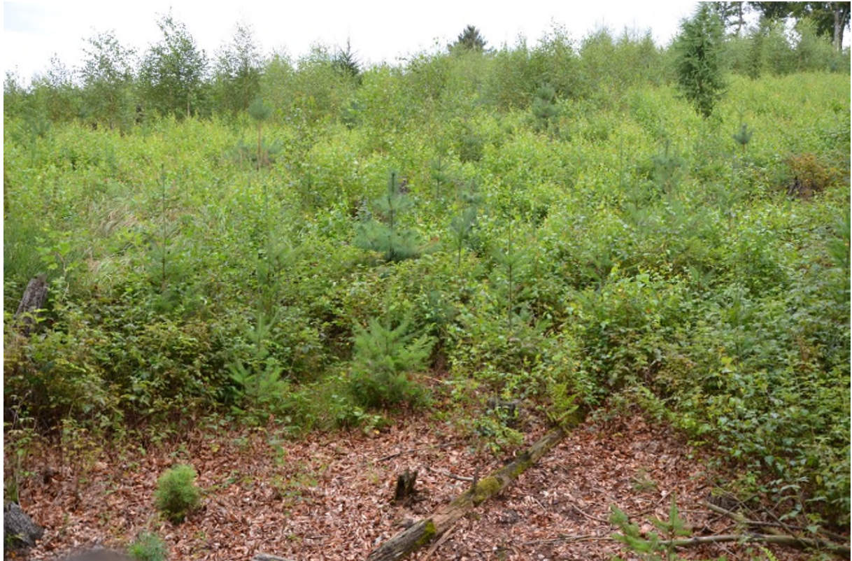
Abbildung 15 Aufforstung der Kyrill-Fläche