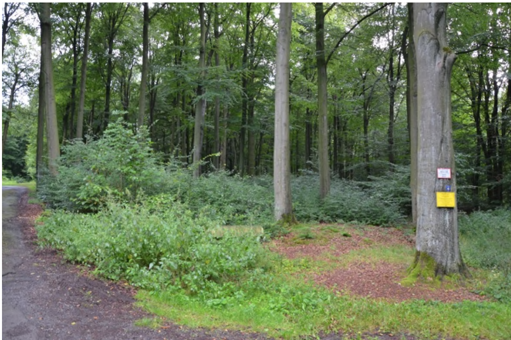
Abbildung 8 Naturverjüngungsfläche