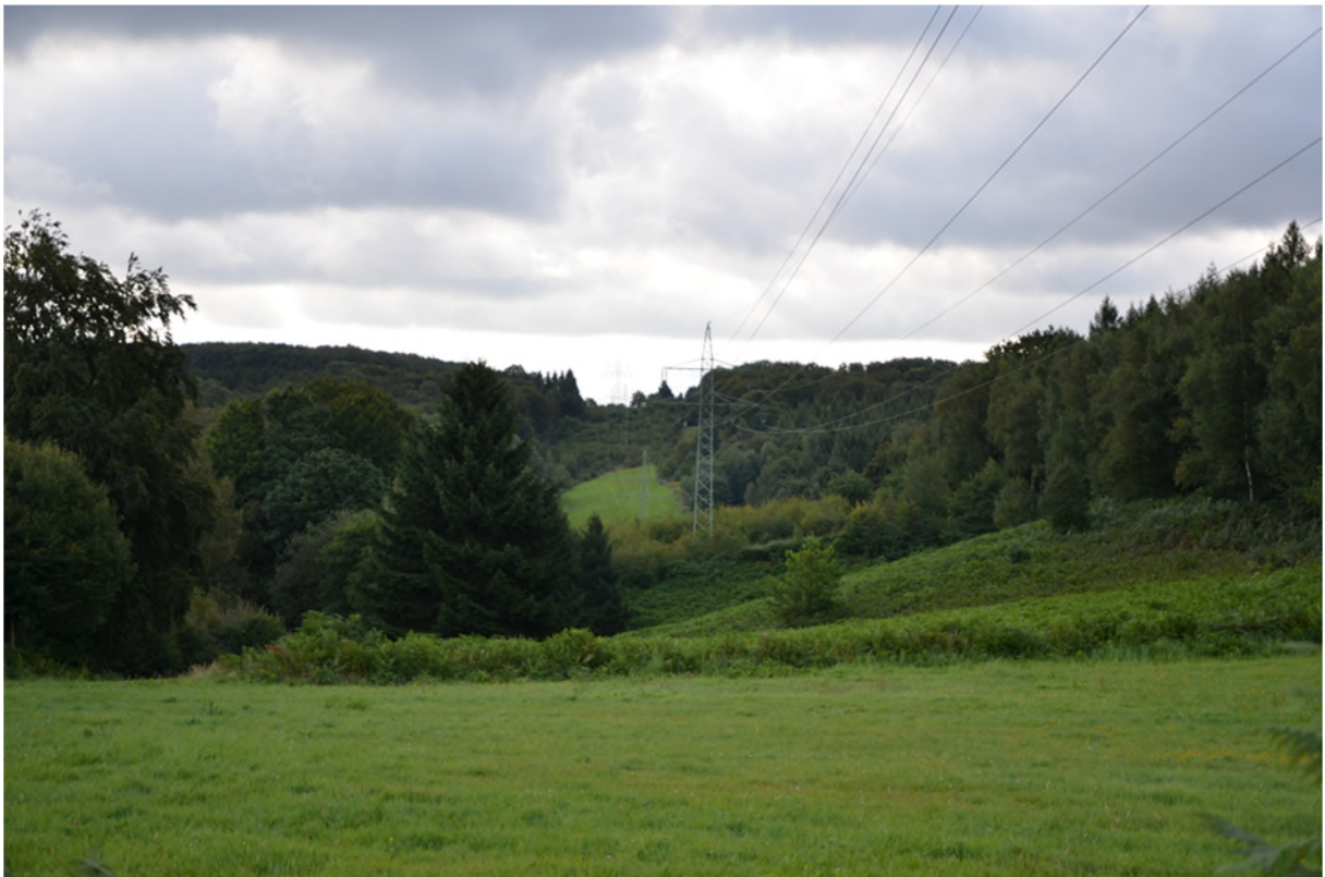
Abbildung 13 Wildwiese im oberen Teil des Bildes