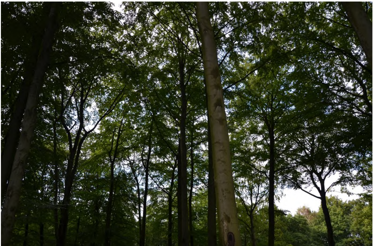
Abbildung 12 Entnahme einzelner Bäume