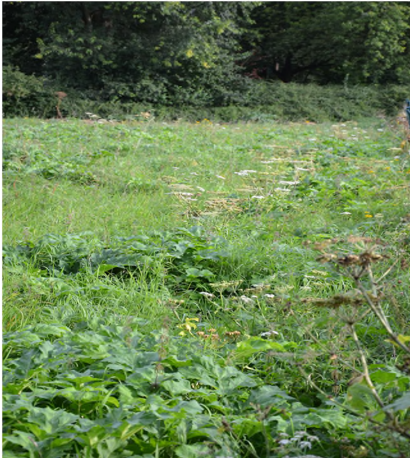
Abbildung 18 Fläche Herkulesstauden