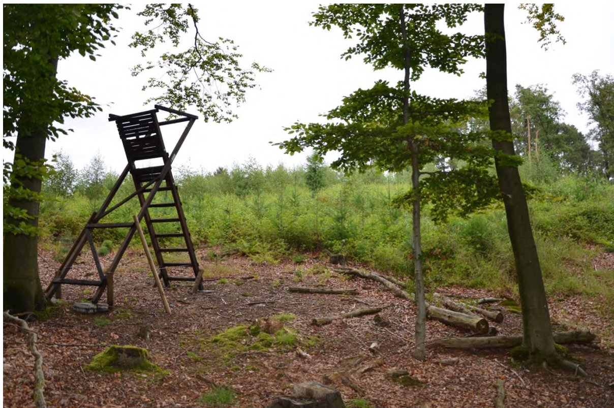
Abbildung 17 Ansitzeinrichtung