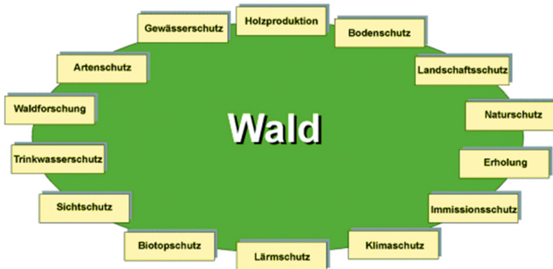
Abbildung 1: Schutzfunktionen des Waldes

Wenn wir jetzt die einzelnen Schutzfunktionen betrachten, an und in dem unterschiedliche Berufs- und Fachkreise arbeiten, wird ersichtlich, wie viele unterschiedliche Meinungen und Regelwerke es gibt, die zusammen kommunizieren müssen/ sollten.