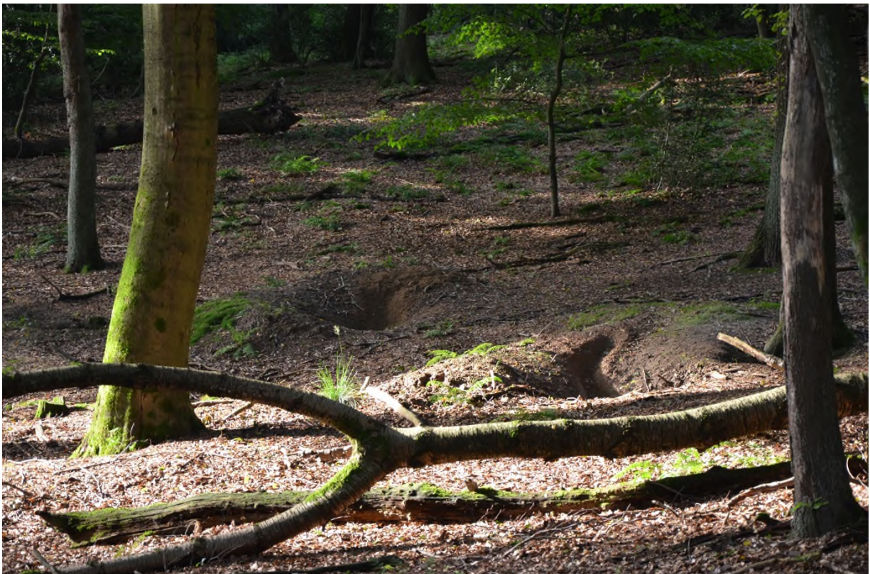
Abbildung 10 Fuchsbau