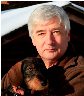
Peter Koch Präsident Deutscher W ildschutz V erband e.V.